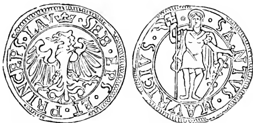
TESTON AU TYPE DU SAINT MAURICE DEBOUT, ÉGALEMENT SANS MILLÉSIME.