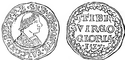
TESTON AU MILLÉSIME DE 1527 AU BUSTE DE L'ÉVÊQUE.