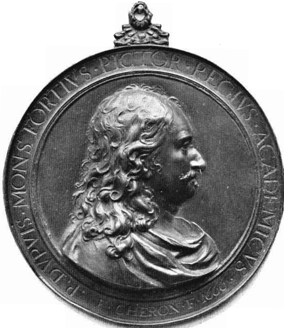
J. MALVAUX, sculp.