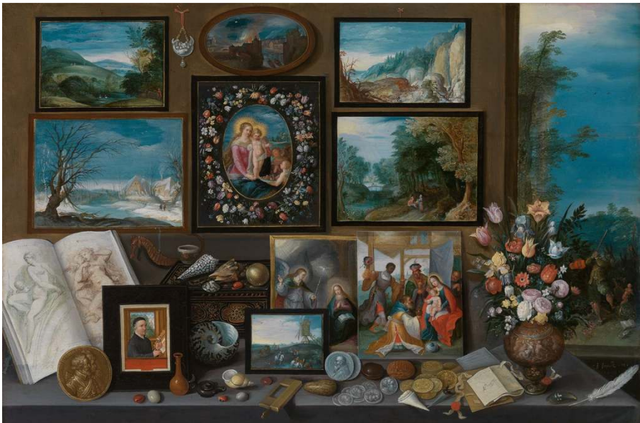
Schilderij 'Een verzameling' door Frans Francken II (Antwerpen 1581-1642) Collectie van het Koninklijk Museum voor Schone Kunsten Antwerpen, Rockox huis

Geïnspireerd op antieke munten ontstaan tijdens de Renaissance de eerste medailles, die ook een interessegebied zullen vormen bij verzamelaars.